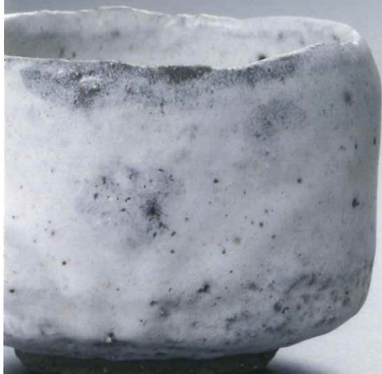
「雪どけ」美作初志野茶碗 11.5×8.8高cm