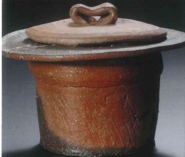
美作南蛮帽子水指 21×15.5高cm